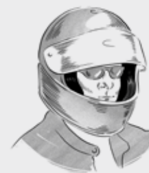
JB, 40 anni

Da quando uso Qooder mi rendo conto di quanto siano vulnerabili le due ruote. Ne ho avuto una prova nella HAT in cui ho coinvolto degli amici inesperti nell'enduro. Pure per loro è stato una rivelazione. Erano così entusiasti per avercela fatta. Con Qooder è stata una grande avventura e ci siamo divertiti come ragazzini. Grazie Qooder.