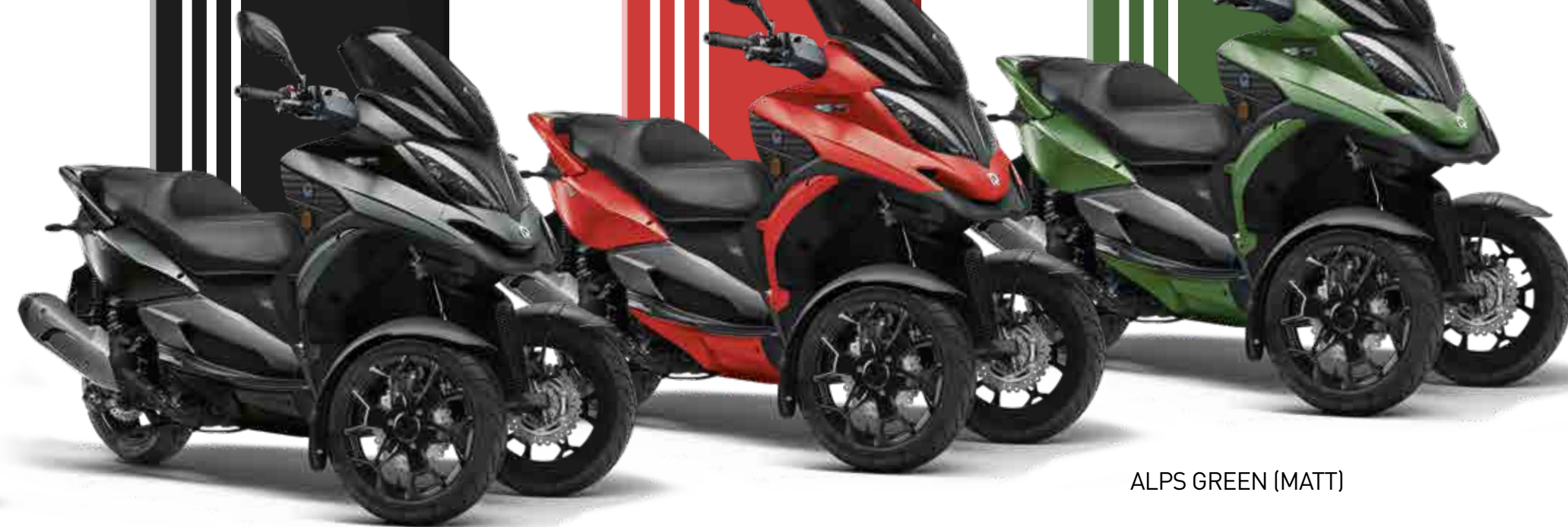
RAW BLACK (MATT)